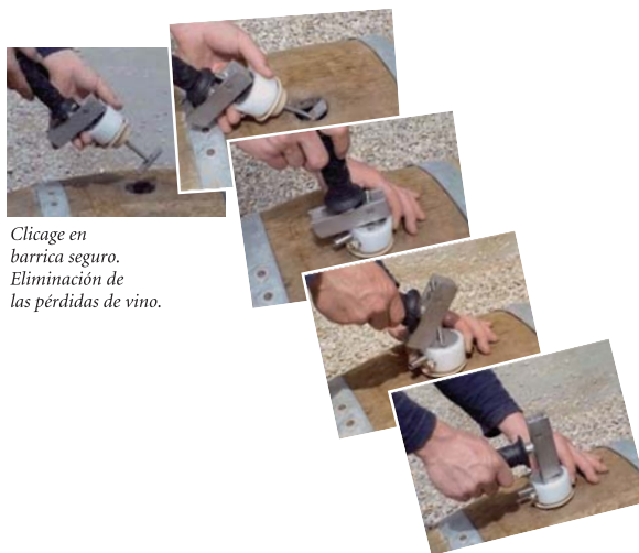
Clicage en barrica seguro. Eliminación de las pérdidas de vino.