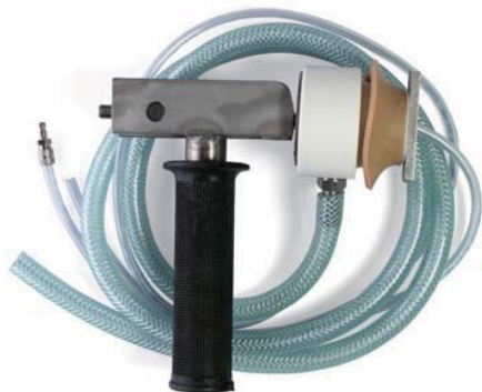
Tapón anti-rebose para las barricas con todos los seguros.