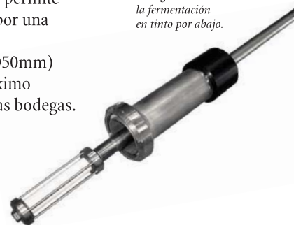
Difusor Cliqueur. Clicage durante la fermentación en tinto por abajo.